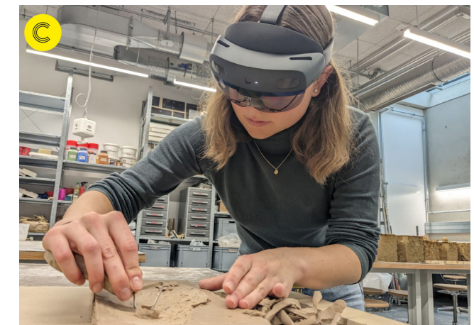
Kurs an der RSDS: CyberCraft Archive - ein fortlaufendes Seminar zur Erforschung neuer Anwendungen von AR, VR, KI und Robotik im Handwerk und in der Bauindustrie

Ein freiwilliges Zusatzfach ist, wie der Name bereits andeutet, nicht in Ihrem Curriculum vorgesehen - wenn Sie einen besuchen und absolvieren hat dieser Kurs keinen Einfluss auf Ihren Notendurchschnitt.