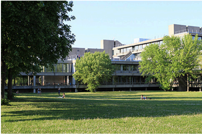
Institut für Pharmazie, Universität Regensburg