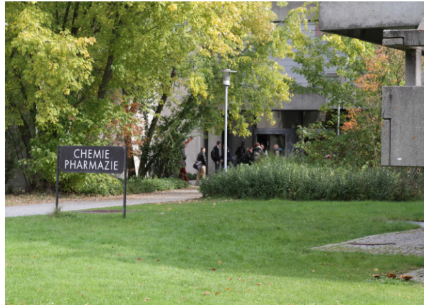
Institut für Pharmazie, Universität Regensburg